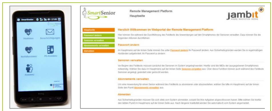
SmartSenior-Startseite auf dem Smartphone und auf der Website zur Verwaltung der Anwendungen

Senioren können Apps für ihr Smartphone nun ganz einfach über ihren Fernseher oder übers Telefon bestellen. Dazu wählt die Seniorin die gewünschte Anwendung aus einer Liste im SmartSenior-TV-Portal mit seiner Fernbedienung aus. Alternativ genügt ein Anruf im Call-Center, und der zuständige Mitarbeiter bestellt die gewünschte Anwendung für den Senior auf einer Website. Die Apps werden dann innerhalb kürzester Zeit ohne weiteres Zutun des Seniors auf dem Smartphone installiert. Zentraler Einstiegspunkt für alle Apps ist die SmartSenior-Startseite